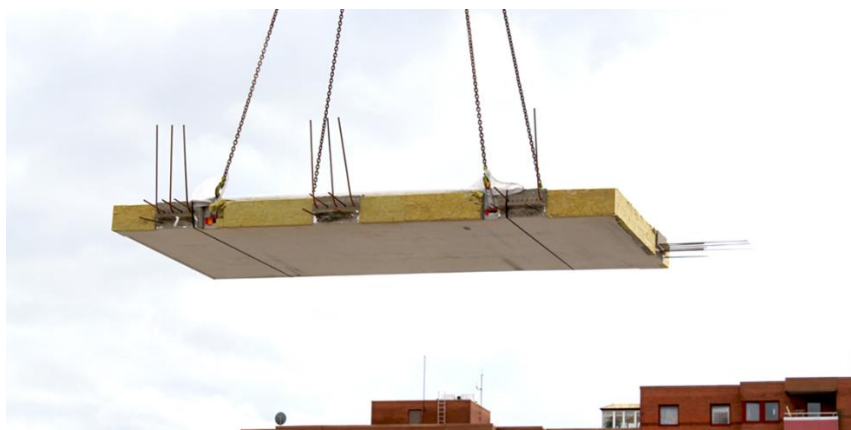
Figur 1 Balkongplatta